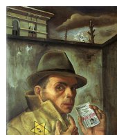
Autoportrait au passeport juif (1943) Félix Nussbaum (1904-44)

Repères historiques et culturels : « L'art dégénéré »