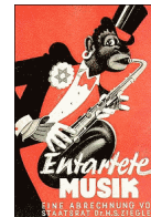
Affiche sur l'art dégénéré « Entartete Musik »