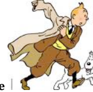
Hergé auteur belge