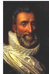
Henri IV (1553-1610)